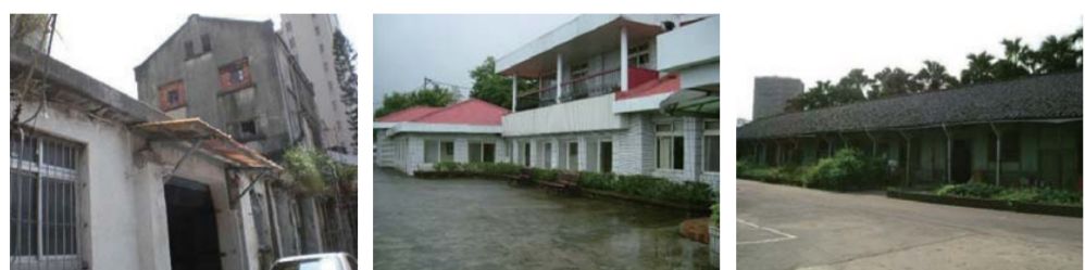
北投穀倉(古蹟) 竹子湖蓬萊米原種田事務所 舊高等農林學校作業室 (歷史建築) (古蹟)

文資鑑定委員之一的臺大農藝系賴光隆教授認為，此三者分別扮演日治時期蓬萊米稻作的貯藏空間、原種培育及學術研發基地，共同見證臺灣農業科技發展史中蓬萊米稻作的誕生。遙想當時相關農業單位技術官員，絡繹來回於竹子湖原種田及臺北高等農林學校之間，宛如穿梭於臺灣北部的蓬萊米走廊。