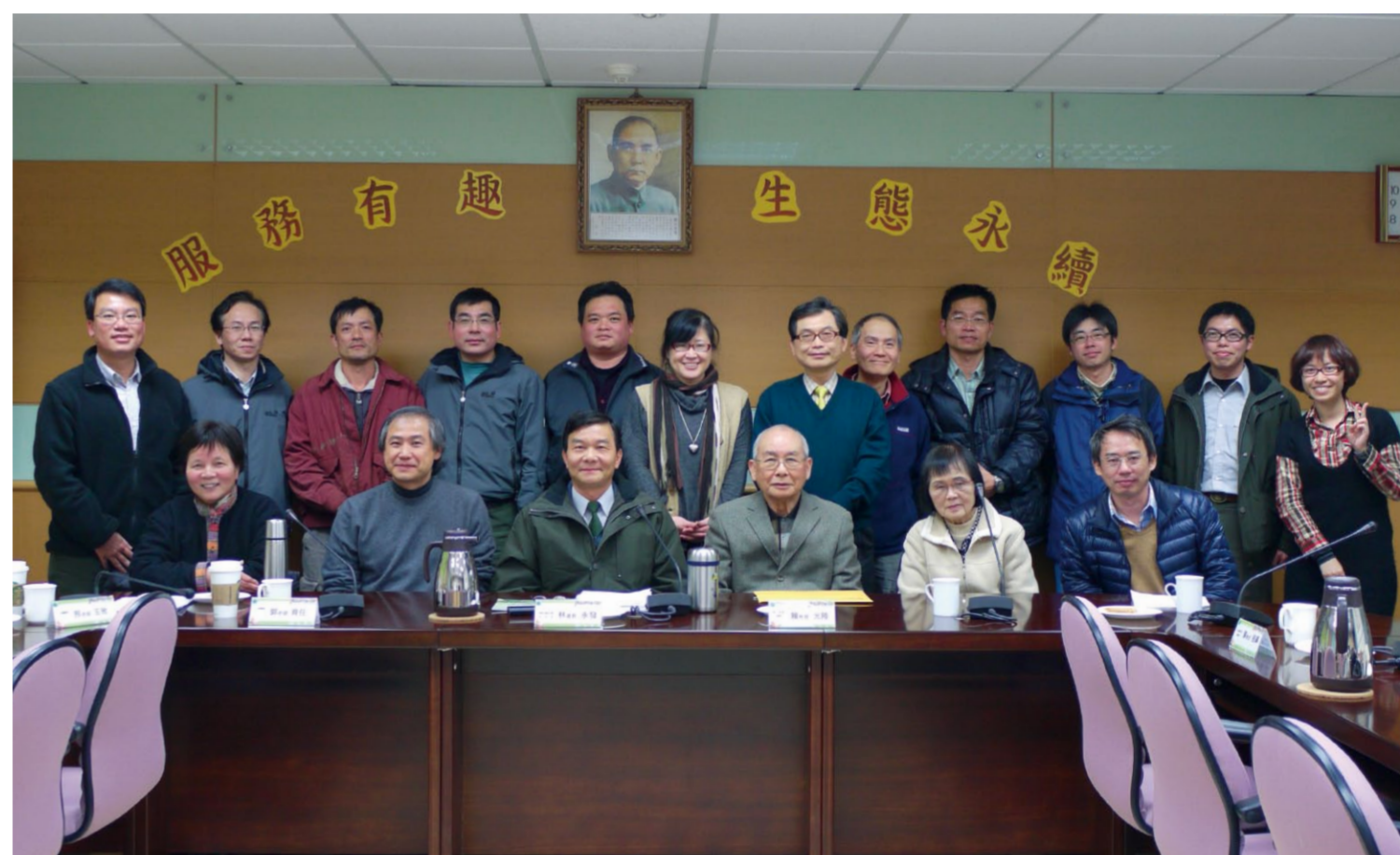
「臺灣北部蓬萊米走廊推動聯盟」夥伴代表合影於陽管處(2012.2.8)